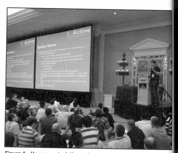
Figura 1 - Un momento della conferenza nella quale Dan Kamins ky ha rivelato i dettagli della vulnerabilità dei DNS da lui scoperta

Tutto si basa sul modo in cui agisce il DNS ( Figura 2 ). Un name server che riceve una query da un client (I), e non ha la risposta già disponibile localmente, non fa altro che rivolgere la stessa query ad un root server esterno (II); se questi ha la risposta pronta la fornisce direttamente, se invece non la ha fornisce un riferimento (delegation) ad un ulteriore name server che potrebbe conoscerla (III). Il name server di origine invia allora la propria query a questo nuovo name server delegato, ed il processo si ripete finché non viene raggiunto un name server autoritativo per la zona ricercata (IV), il quale può infine fornire la risposta definitiva alla query originale (V). A