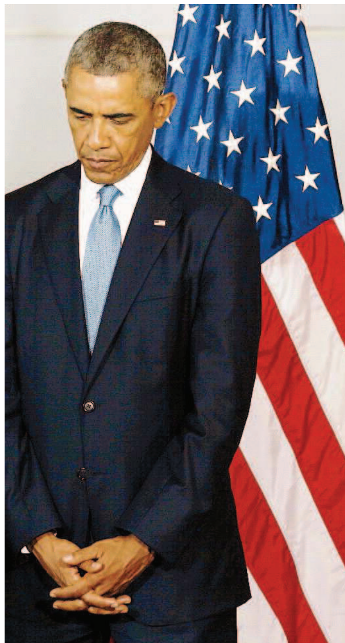
Barack Obama ieri a Tallinn, in Estonia