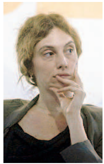
SENZA SOLDI Marianna Madia, ministro per la Pa

Il ministro della Pubblica amministrazione: «In questo momento non abbiamo risorse» Italia al penultimo posto nella classifica del tasso di occupazione, peggio solo la Grecia